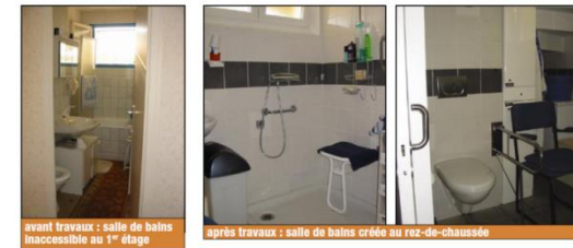
Création d'un espace sanitaire adapté